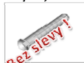
PVC hmoždinka na O,OD,ODD