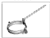
Objímka - hrot 300 mm