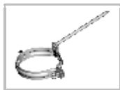
Objímka šróbovací - hrot 150 mm