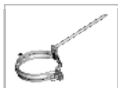
Objímka šróbovací - hrot 200 mm