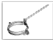
Objímka - hrot 150 mm