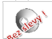
PVC ochranní krytka na O,OD,ODD