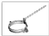
Objímka šróbovací - hrot 300 mm